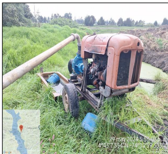
Ilustración 5. Motobomba

Dicha alteración se encuentra ubicada en el predio denominado “ISCALA 1” ubicado en la vereda El Hato del municipio de Funza (ver ilustración 6, polígono amarillo), en el cual se llevan a cabo actividades agrícolas.