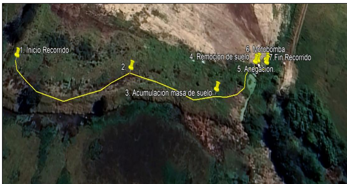
Ilustración 1. Recorrido verificación ambiental -Vereda El Hato

El día 29 de mayo de 2024, se realizó recorrido de control y vigilancia en la ronda del humedal Gualí desde las coordenadas 4°43'10.367"N - 74°11'2.976" W hasta las coordenadas 4°43'7.517"N - 74°10'59.358" W (ver ilustración 1. Ruta amarilla) ecosistema que fue declarado por la Corporación Autónoma Regional de Cundinamarca - CAR como Distrito Regional de Manejo Integrado a través del acuerdo 001 de 2014 "Por medio del cual se declaran como Distrito Regional de Manejo Integrado (DMI), los terrenos comprendidos por los humedales de Gualí, Tres Esquinas y Lagunas de Funzhé, y su área de influencia directa ubicada en los municipios de Funza, Mosquera y Tenjo, Cundinamarca", y estableció tres zonas: 1. Preservación (espejo de agua), 2. Recuperación (50 metros) y 3. Uso sostenible (100 metros), con el fin de verificar las condiciones ambientales, identificar posibles afectaciones a los recursos naturales y realizar las acciones de prevención correspondientes.