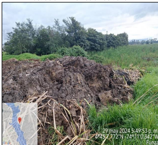
Ilustración 3. Acumulación de material de excavación.

Adicional a ello, se evidenció que dicha intervención permite el ingreso de aguas pertenecientes al Humedal Gualí al interior del predio dando lugar a la anegación del mismo (ver ilustración 4), con el fin de realizar la presunta captación de agua superficial con la motobomba encontrada en las coordenadas 4°43'7.554"N - 74°10'59.333" W (ver ilustración 5).