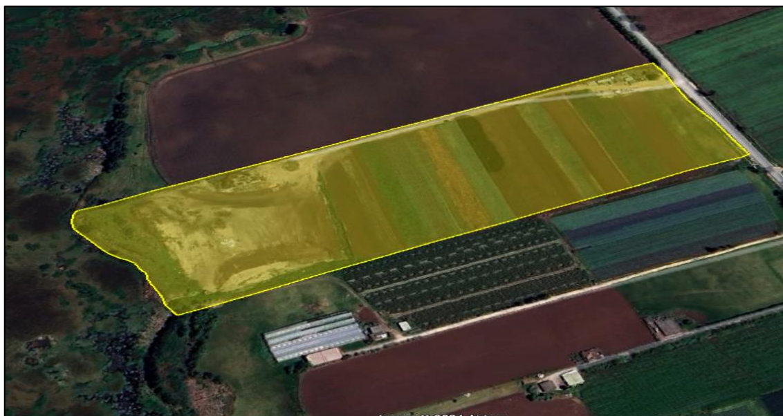
Ilustración 6. Predio ISCALA 1.

El predio denominado “ISCALA 1” se encuentra identificado con cedula catastral 252860000000000070003000000000, de conformidad con la consulta realizada en el geoportal del Instituto Geográfico Agustín Codazzi IGAC (ver ilustración 7)