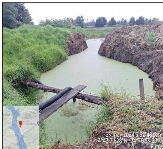
Ilustración 4. Formación de anegación.

C.P. 250020 Tel. +57(1) 823 40 70 823 40 71 / 823 40 73 Fax. + 57(1) 825 76 20 Dir. Cra. 14 No. 13-05